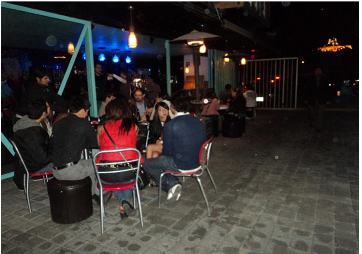
Foto1: Bar. Mesa como elemento configurador para la interacción social.

Otro elemento que funciona es la mesa, la mesa se es compartida con el grupo de amigos con los que se está practicando la noche, la comodidad de la mesa puede beneficiar la sociabilidad en la conversación, esto sobre todo en bares (véase foto1 ). En el caso de los antros la mesa sirve como instrumento de apropiación en el que se coloca la bebida que se está consumiendo, así como también se da cuenta de un lugar que está siendo practicado a partir del baile como interacción social.