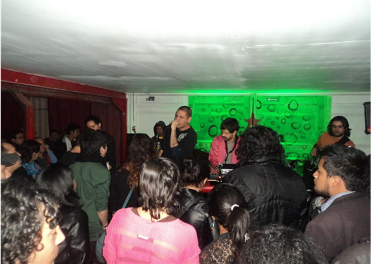
Foto4: Tocado en un bar 3

El corredor nocturno se convierte en un espacio festivo, sobre el cual existe una producción de espacios que venden un ideal de fiesta en los que se propicia el encuentro con los otros y el consumo de alcohol, que van relacionados con las maneras de compartir el espacio y de llevar a cabo la sociabilidad.