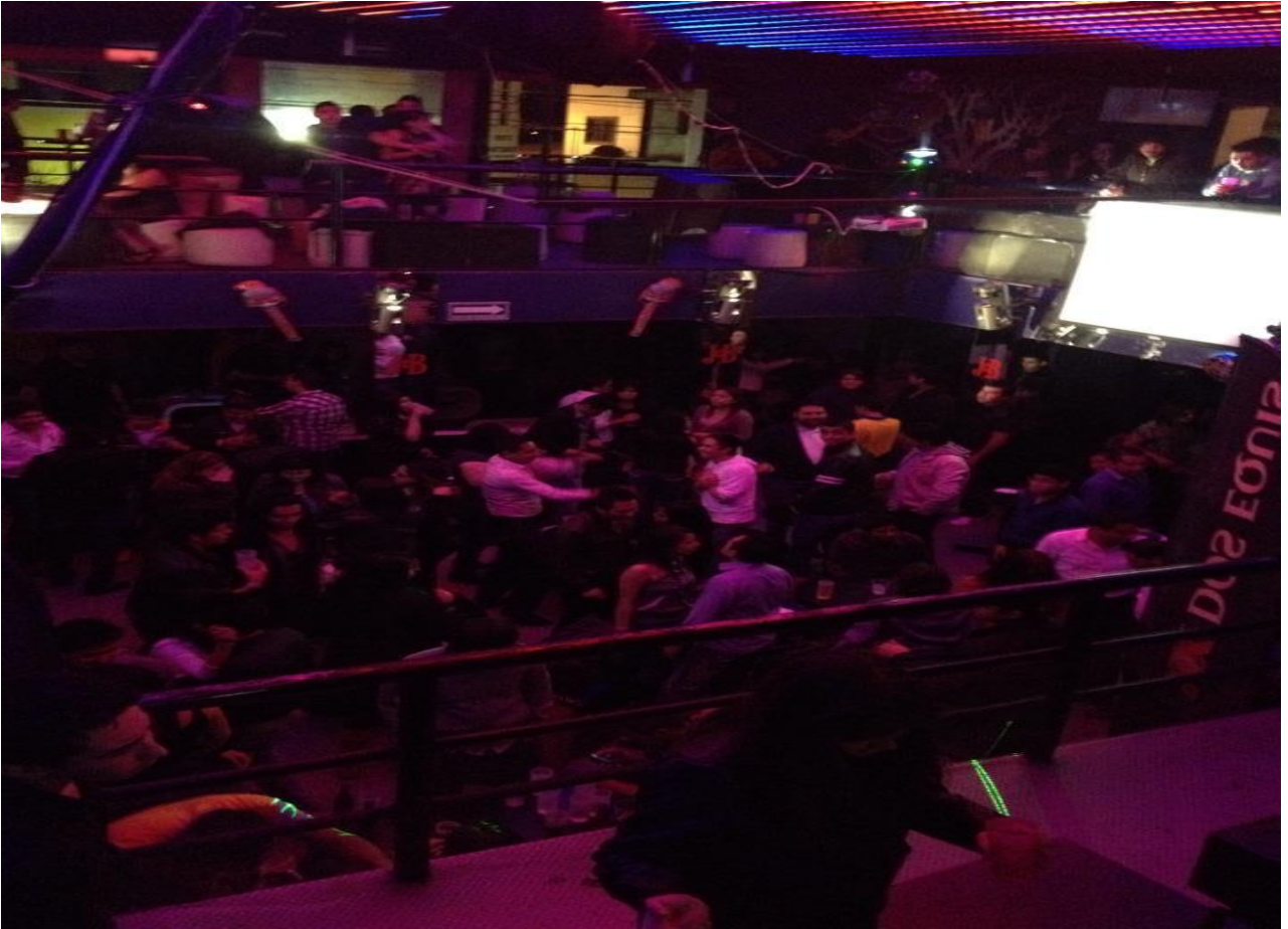
Foto 3. Antró 2

En las tocaditas como anteriormente se mencionó se muestra la atención en la banda, la apropiación se da cuando los noctámbulos asisten a estos espacios con la finalidad de escuchar a un tipo específico de música que varía según sus gustos. En la tocada, el baile es un móvil de sociabilidad que expresa por un lado, que se presta atención y disfruta de la música que está de fondo, y por otro lado, que se está compartiendo el espacio por un gusto en común, lo cual puede ser un móvil de sociabilidad, puesto que en esa temporalidad todo gira en torno a la apropiación a través de la música, como son los silencios cuando el representante de la banda habla y los aplausos que continúan como ritual después de tocar una canción.