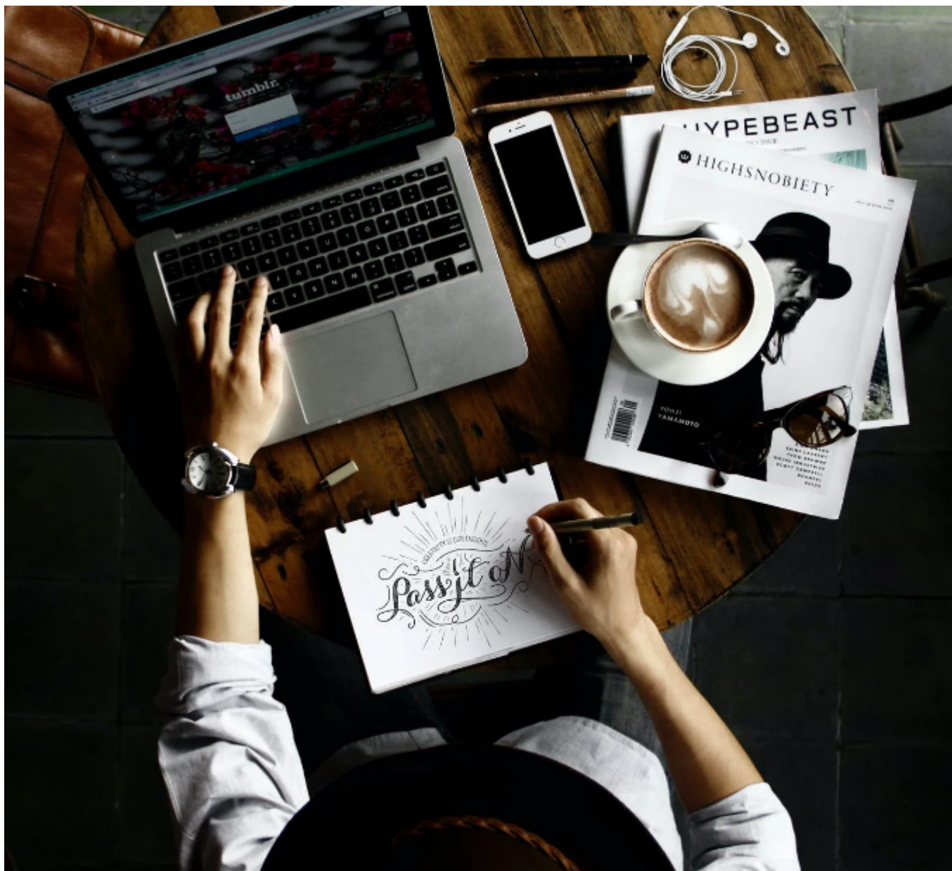
Ovan. Persona sentada frente al ordenador portátil con blog de dibujo

Misión 4, Actividad práctica con el uso de dos colores de sombrero.