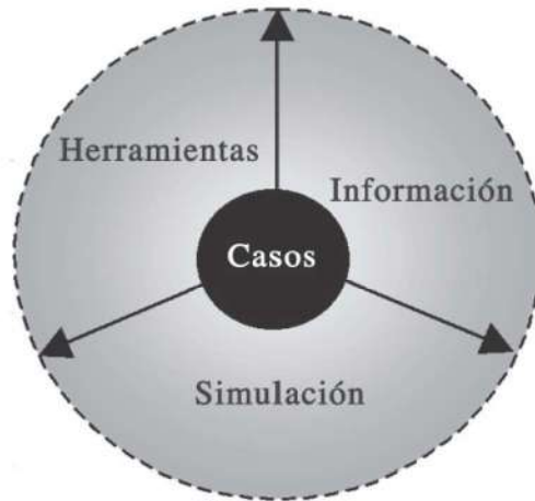
Figura 2. Componentes de un AIDA

en ese caso, sino que tome ideas del mismo que dispararán su propio proceso creativo para buscar nuevas opciones de solución para el problema que le estamos pidiendo. También, estos casos sirven para darle los conocimientos que sabemos que no tiene, pero que son necesarios para aprender en un AIDA dado.