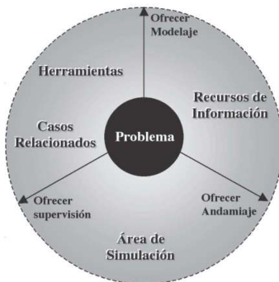
Gráfica 1: Modelo adaptado para diseñar un AIDA

En la Gráfica 1 podemos identificar tres elementos del Modelo: Problema, tres ejes y una serie de elementos de apoyo: herramientas, casos relacionados, recursos de información y un área de simulación. A continuación se describe cada uno de ellos: