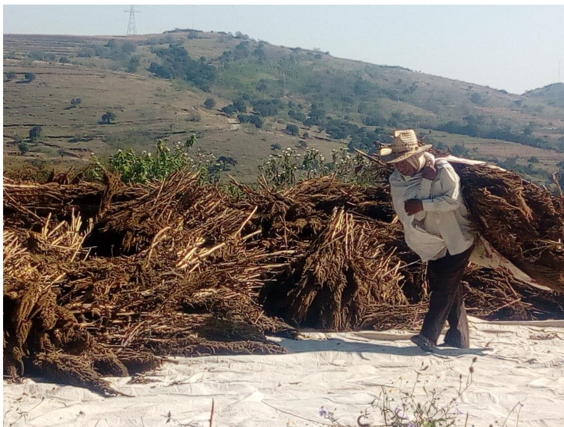
Ilustración 14 Secas las plantas las juntan en una lona para ser aplastadas y extraer la preciada semilla.

Una fase que es muy importante es la de preparar el suelo, es decir, buscan la parte más plana y la detallan con un azadón aplanando las elevaciones o bordes, se retiran las piedras, y se afina todo lo anterior por medio del tractor. También por medio del machete se limpian las orillas y el pasto que cortan lo dejan en la parcela a manera de abono natural.