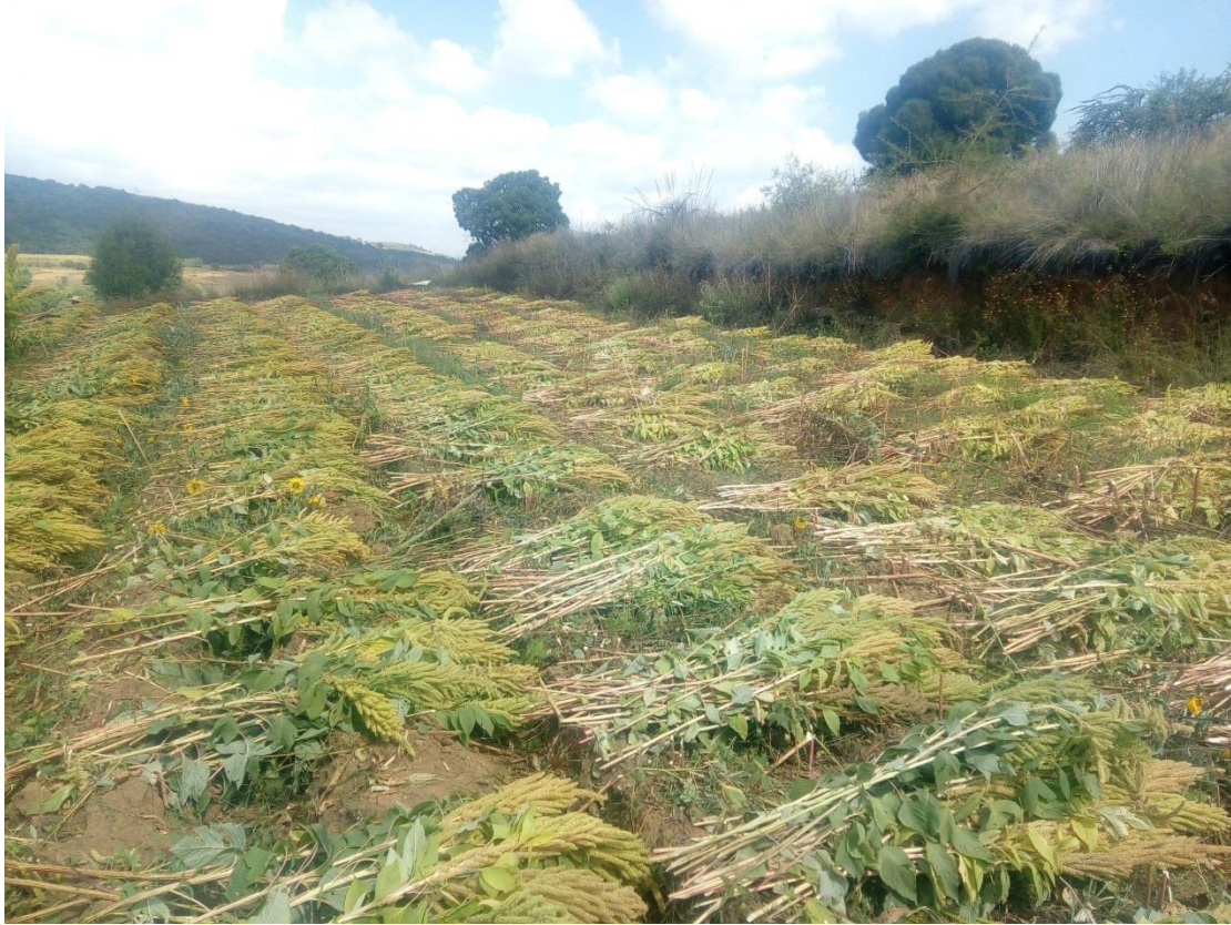
Ilustración 3 Se colocan ordenadamente por encima del surco de tal manera que la flor no toque la tierra y se deja secar por dos semanas.

Un aspecto importante que ocurre durante el corte, también, los que participan se percatan de que no todas las plantas sirven, algunas concentraron alguna plaga y no generaron semilla, también algunos aprovechan para identificar o bien agrupar en relación al tamaño de las flores las más grandes, se seleccionan para la siguiente cosecha, de modo que durante el recorrido entre los surcos los cortadores van observando e identifican aquellas cuyas flores estén “tupidas” y además sus tallos se aprecien fuertes; estas plantas se quedan en pie o las cortan y las marcan con algo, un listón, un hilo o un pedacito de tela, o se colocan en un sitio especial para no revolver con el resto; lo explicaron así: