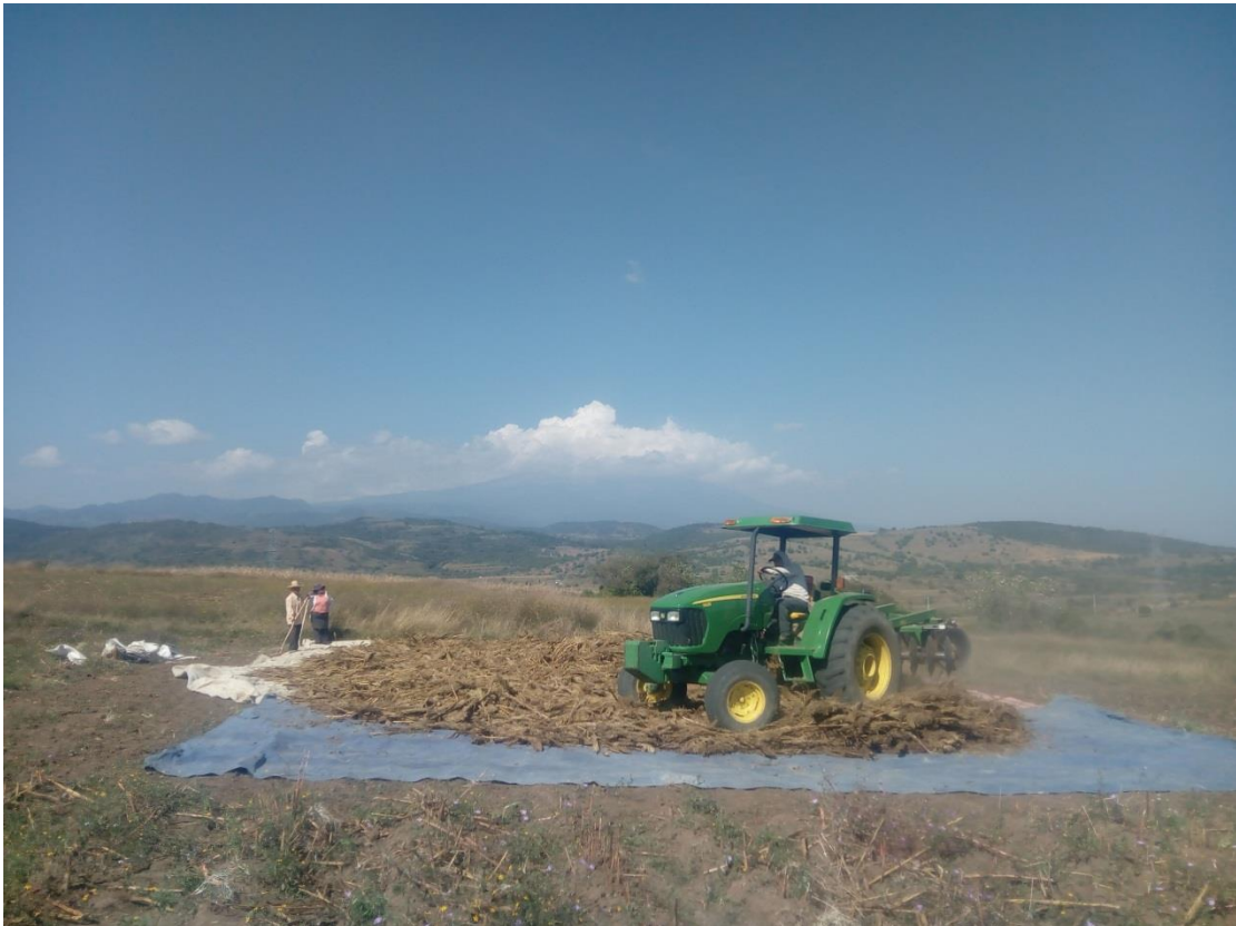
Ilustración 154 El tractor recorre circularmente el área donde están las plantas. Da muchas vueltas circularmente.

Las plantas distribuidas sobre la lona recibirán el peso del vehículo, ya que se ha preparado el espacio para que pase por encima a fin de triturarlas; el tractor se mueve en círculos, da varias vueltas en diferentes direcciones sobre la cosecha extendida, mientras las lascas, o las cuchillas, cortaban la paja y la espiga separando la semilla sin dañarla. Mientras los demás con las horquetas dan vuelta al montón de plantas y juntan las que con el movimiento generado por el motor se van a la orilla de las lonas.