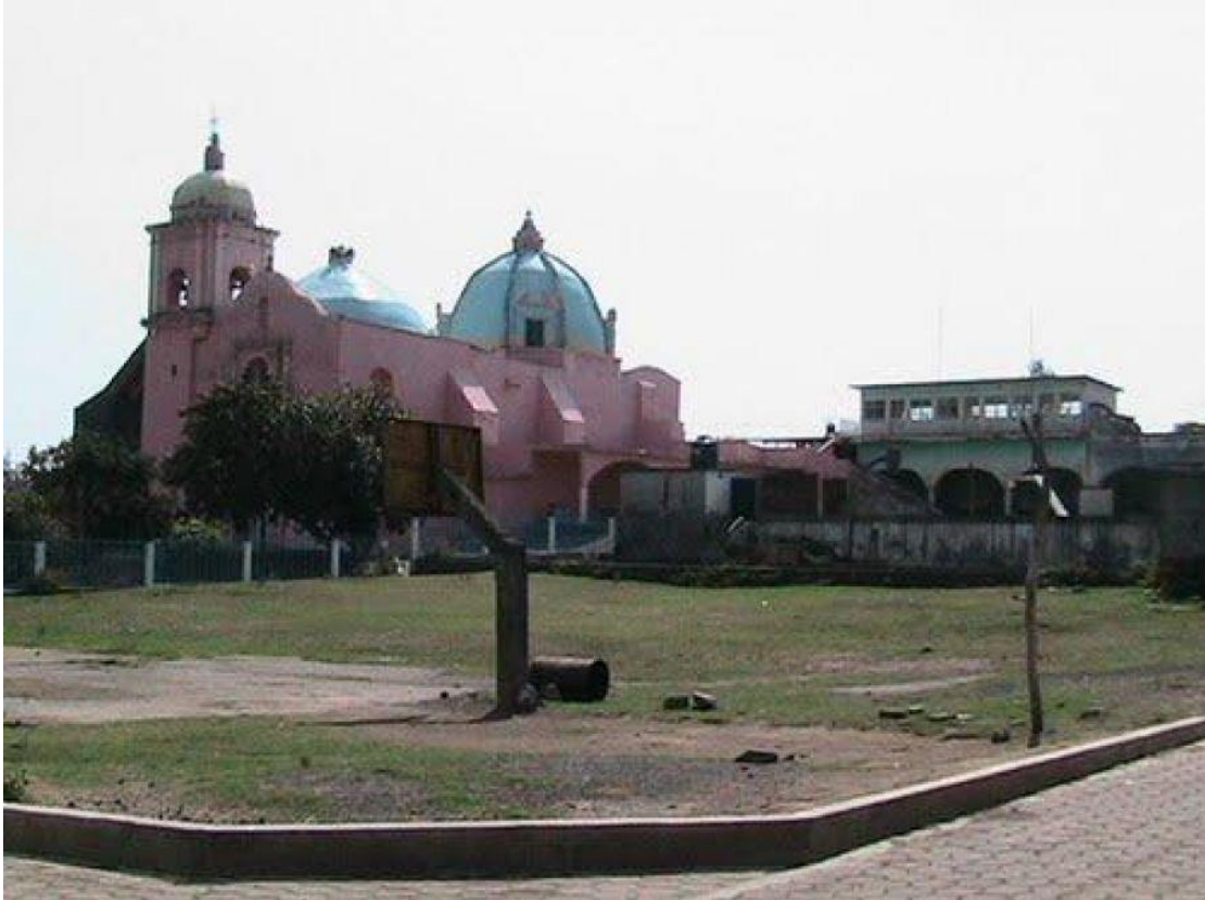
Ilustración 3 En la manzana del centro del poblado se encuentra una explanada, una cancha de básquetbol, a la derecha la antigua escuela primaria, en el costado izquierdo se aprecia el ex convento de Nuestra Señora Santa María de la Asunción de 1543. Estos últimos con graves afectaciones por el sismo de 2017.

Aparte de la infraestructura de la iglesia católica también se puede apreciar la presencia de las haciendas en las que se basaba el modo de producción del periodo colonial e independiente, la más cercana se encuentra en Atlixco, la Ex hacienda de Metepec. En el año de 1792 esta área es nombrada partido de la intendencia de Puebla, y no es sino hasta 1895 que se constituye en municipio libre quedando como cabecera municipal el pueblo de Tochimilco (INAFED, 2010).