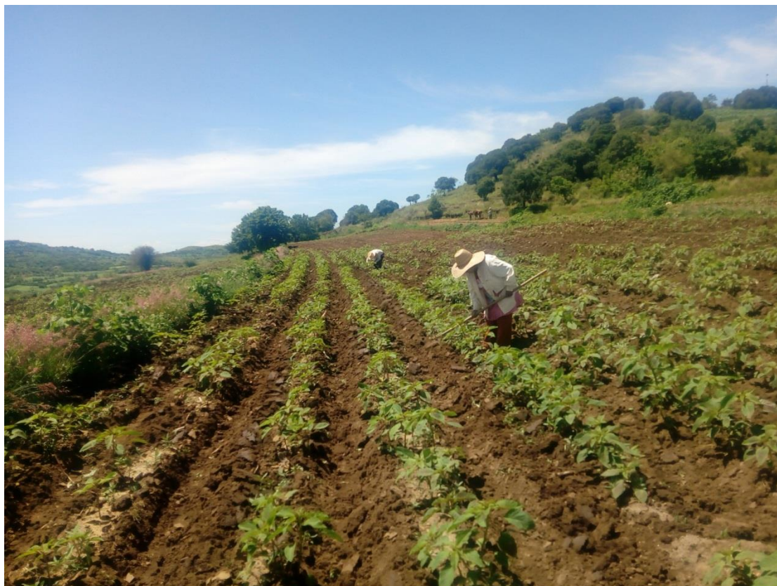
Ilustración 10 Deshierbe y raleo, es una actividad que consiste en recorrer los surcos dejando tres o cuatro plantas de cada punto donde nacen, y con el azadón se junta la tierra en la base del tallo. Esto permite después de la germinada, el buen crecimiento.

labor la realizan entre dos o tres personas, pueden participar más, pero con estos agentes es suficiente. Se observan las plantas más altas, con tallos y hojas grandes. Se debe distinguir bien la forma ovalada de la hoja, porque crecen yerbas silvestres o plantas domesticas como maíz, chíá, frijol, o algo que hayan sembrado antes. Por lo que es muy importante esta identificación. Y así mientras las plantas crecen el campesino recorre surcos realizando estas labores que son manuales.