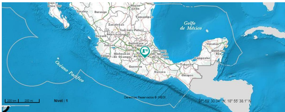
Ilustración 1 Tochimilco es uno de los municipios del Estado de Puebla, ubicado en el altiplano y centro del país.

El espacio social de interés fue la localidad campesina de San Lucas Tulcingo que forma parte del municipio de Tochimilco 33 , ubicado al noroeste de la ciudad de Puebla en las laderas del volcán Popocatepetl. Sitio que presenta contrastes orográficos muy marcados, su topografía es irregular sobre todo en la parte alta que abarcan zonas boscosas de la Sierra Nevada y del volcán Popocatepetl. Las zonas bajas cuentan con gran cantidad de cerros, llanos y barrancas que poco a poco conforman valles 34 donde se practica la agricultura. Como se mencionó es un territorio cubierto de bosques al norte y noreste de cedros, pino y encino que han sido talados para utilizar madera, o para acondicionar zonas de cultivo, sobresale en los espacios abiertos una gran diversidad de fauna silvestre; demográficamente cuenta con un total de 17,956 habitantes (INEGI, 2010) distribuidos en una cabecera y diez juntas auxiliares 35 .