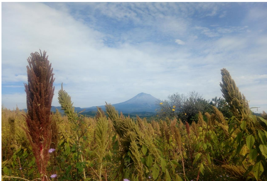
Ilustración 2 Parcela de amaranto en zona volcánica. Las panojas de las plantas de amaranto resaltan por sus formas y coloridos. Están listas para el corte.

El corte se realiza a partir de los primeros 10 días del mes de noviembre, es una actividad en la que participan la mayoría de los integrantes de la familia; etapa que se asocia con el fin del temporal de lluvias y con el ambiente frío y seco. Los campesinos acuden a sus terrenos en auto, bicicleta, moto, carreta jalada de caballos o mulas, así como a pie; hay algunas parcelas que están en lo alto o ubicadas en las laderas de los cerros, por lo que además se debe realizar el ascenso hasta esos puntos, esto no implica amplia dificultad, ni mucho desgaste físico y además de apreciar los cultivos cercanos, por ejemplo: chía,