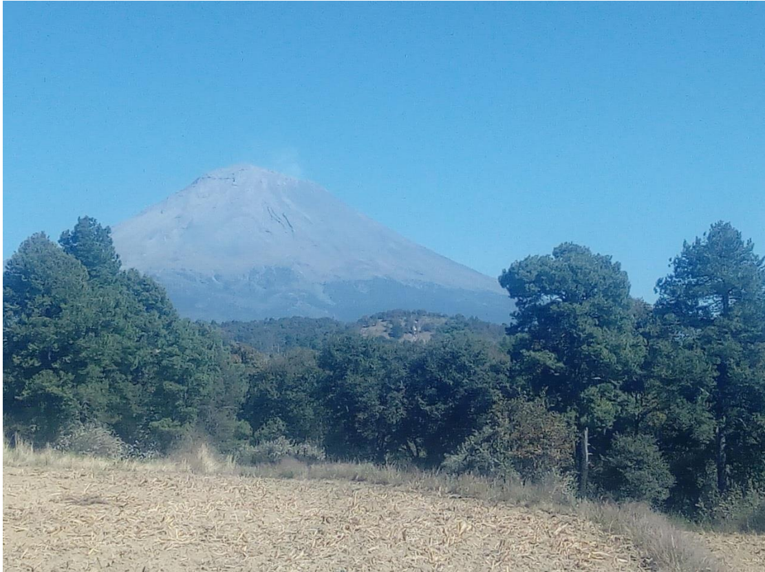
Ilustración 4 Por su cercanía al volcán Popocatepetl las imágenes paisajísticas son impactantes, se mira desde distintos puntos de San Lucas. Las localidades campesinas volcaneras se han acostumbrado a vivir en las cercanías del imponente coloso activo: lo escuchan crujir, hace temblar la tierra reciben las cenizas que fertilizan sus cultivos; para ellos don Goyo es un ente que vive con los pueblos, tanto así que los locales le adjudican estados emocionales: “se molestó” o “está tranquilo”.

Otro de los momentos más fuertes se recuerda el 15 de diciembre del año 2000, cuando cerca de 40 mil personas abandonaron sus casas y evacuaron los poblados de la zona aledaña a Tulcingo, no obstante muchas personas se negaron a salir por miedo al robo y la rapiña, algunos otros, por el afecto y apego a sus animales y su tierra, días después el 24 lanzó fragmentos incandescentes a 2.5 km, produciendo una columna de ceniza de aproximadamente cinco kilómetros sobre el cráter, Posteriormente al disminuir la actividad la población regreso a sus hogares.