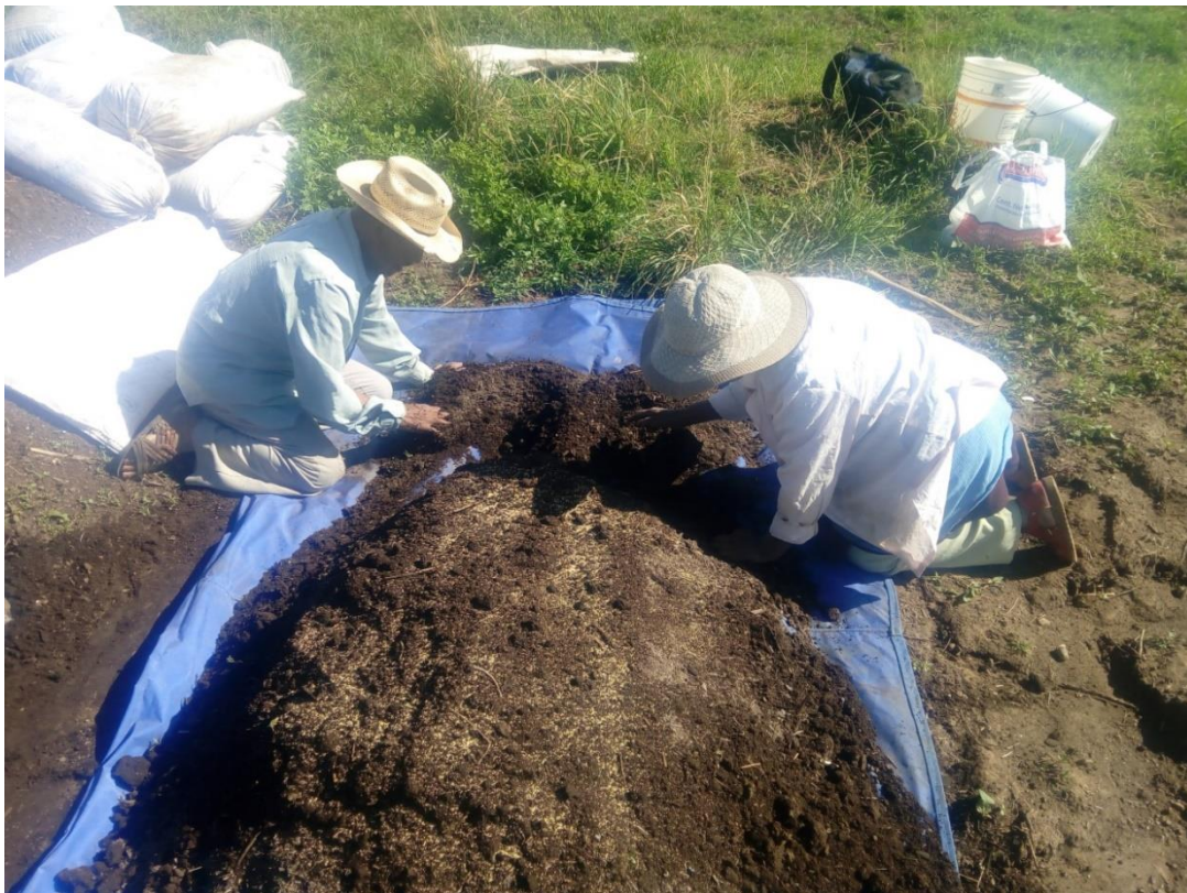
Ilustración 9 Preparar la semilla con abono para la siembra. Se mueve el compuesto para que se mezcle adecuadamente.

Una vez que cuenta con la semilla, se le prepara al concentrarla en una lona en la que también se vierte el abono, que puede ser de animal o de composta, con la intención de que se combine al revolver, una vez que se ha logrado mezclar, se vacía en costales y después en cubetas de 20 litros, con la intención de transportar estos contenedores hasta la unidad de producción.