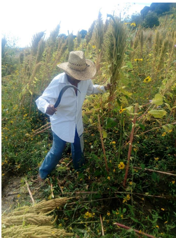
Ilustración 12 El corte consiste en tomar un ramo de plantas con una mano y con la otra se usa la OZ para cortar haciendo un movimiento con el cuerpo que permite tronar con el filo los tallos.

El corte de la planta con machete implica la complejidad de una práctica epistémica, no sólo es técnica, para manipular la herramienta, sino calcular fuerza, postura corporal, lo cual implica un proceso constante de cálculo, ya que como se decía antes, hay plantas grandes otras pequeñas, hay terrenos llanos, pero también los hay inclinados, ante ello se expresa que los cortadores saben pisar bien entre los surcos para tener buen equilibrio y realizar las maniobras, en fin juegan muchos factores; por ejemplo la altura para realizar el corte a la planta, se realiza “desde abajo”, es decir al ras, esto se debe a que se recomienda no dejar “picudo” el tallo de la planta, ya que al pisarlo los participantes se pueden lastimar, por lo que se trata de quitar o cortar los más al ras posible, ello implica, también tener la capacidad física para permanecer por varias horas en una postura corporal inclinada, al permanecer agachado, ya lo he referido antes, pero tanto mujeres como varones cuya edad oscila entre los 60 y 70 años, denotan