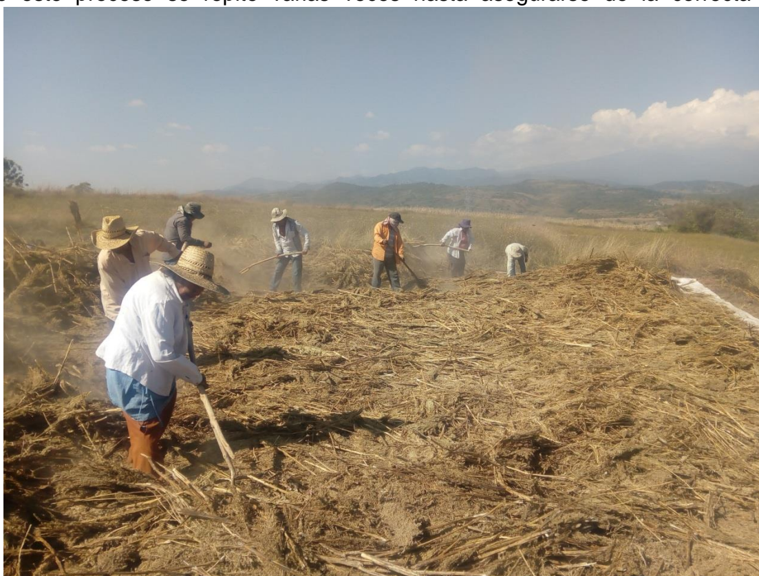
Ilustración 16 La familia campesina participando colectivamente, volteando las plantas trituradas con una horqueta.

Posterior a esto, se realiza al día siguiente el cernido y limpieza de la semilla, para ello de nuevo se hace uso del tractor ya que se busca asegurar que tanto las ramas, los tallos y partes grandes de la planta quedan solos, de modo que este proceso se repite varias veces hasta asegurarse de la correcta