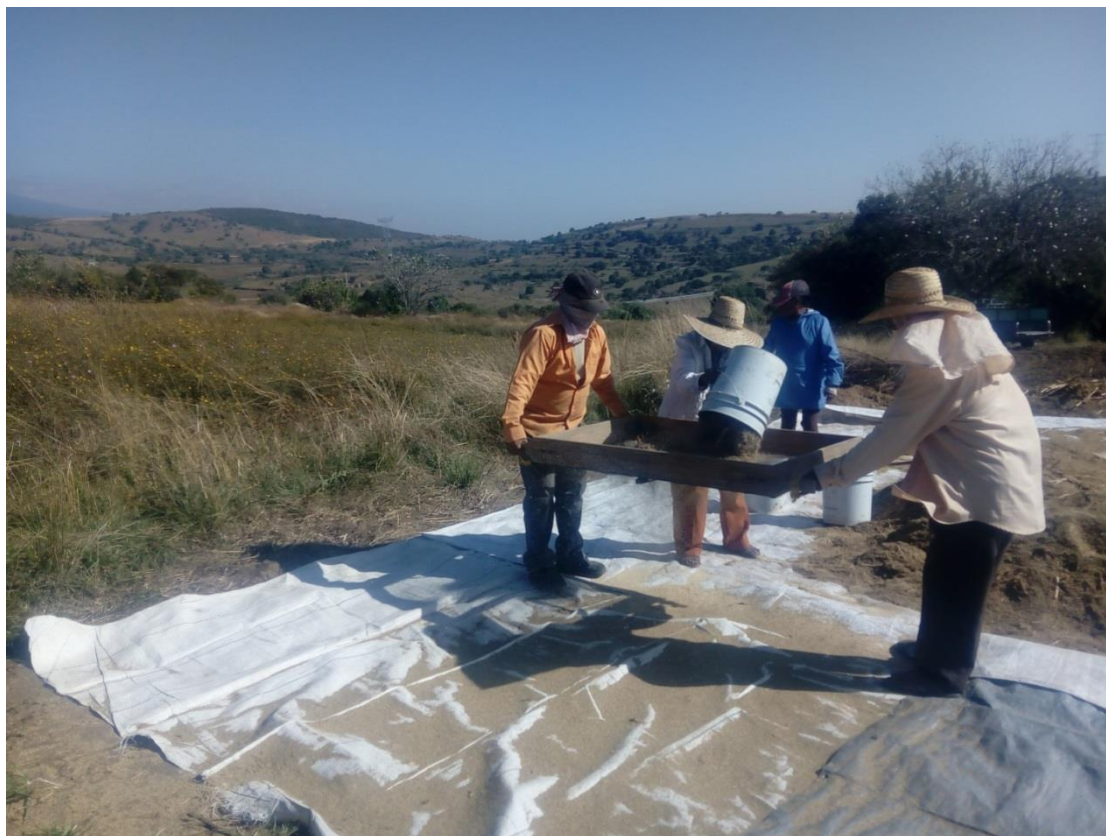
Ilustración 18 Limpiar la semilla. La criba consiste en cernir la semilla que aun esta revuelta con paja de la planta.

Forjada por el trabajo de cientos de surcos recorridos la corporalidad campesina se expresa en la capacidad de ejecutar, manipular, sentir, evocar, por medio de sus sentidos que cobran especial relevancia para reconocer una planta