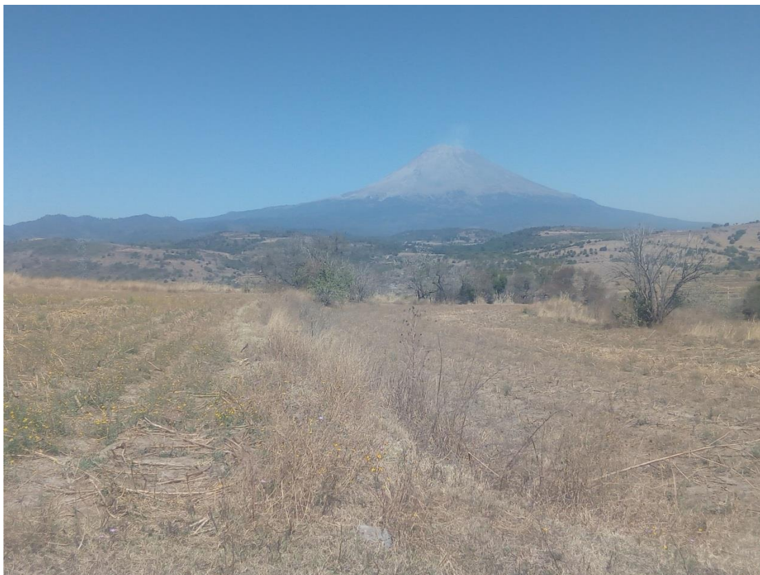
Ilustración 5 Al suerte del poblado en el área que los locales conocen como Teputzco, es un gran llano caracterizado por tener una tierra amarilla, con cualidades barrosa, el suelo se compacta con facilidad y es duro, sin embargo no impide la actividad agrícola. En el invierno cambia el paisaje a tonalidades amarillentas, opacas y grisácea, el clima es frío y muy seco.

Entre los terrenos destinados al cultivo se distinguen aquellos que cuentan con riego, por ejemplo los espacios conocidos como Rancho y Alaila; de los que carecen de este tipo de acceso a canales de agua que se extrae del subsuelo.