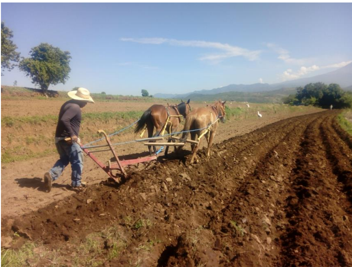
Ilustración 8 El arado sirve para hacer los surcos. El campesino trabaja con el arado, toma el timón para manejarlo.

Con relación al arado, es una tecnología que no es de tradición mesoamericana ha sido parte de la inclusión de la difusión cultural que trajo consigo la conquista a los pueblos originarios. Sirve para mover la tierra, abrirla cuando esta comprimida, hacerla porosa para que las raíces de las plantas se desarrollen bien. Este mecanismo de tracción animal es jalado con caballo, aluden el empleo de éstos animales, ya que es más barato para la economía familiar, tanto comprarles como mantenerlos, tienen un costo entre $15 a $20 mil pesos, no suelen emplear toros ya que en los mercados tienen una cotización de hasta $30 mil pesos, pero tienen más fuerza. En los poblados vecinos siguen